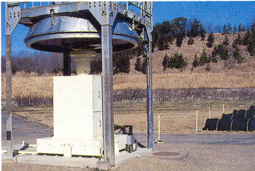
第1図 照射塔の下に設置した新遮蔽体 Fig. 1. The supplemental shielding under the irradiation tower.

なお、当報告での放射線の測定および測定値の1cm線量当量への換算と評価については、日本アイソトープ協会技術一課および技術二課の協力を得て、エネルギー補償型のNaI(Tl)シンチレーション・サーベイメータ(アロカ社 TCS-161)の測定値に基づいて行った。(矢頭 治)