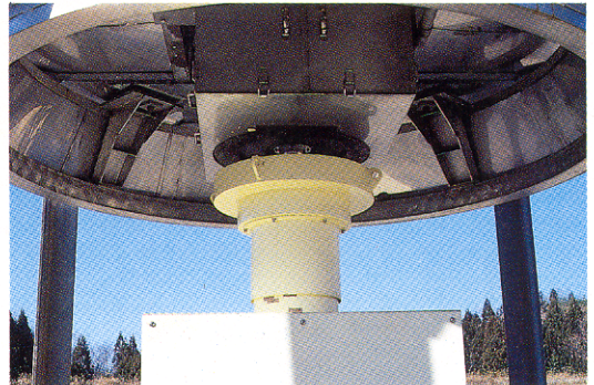
第2図 ^{60}\text{Co} 線源直下に設置した遮蔽体の本体 Fig. 2. The shielding under the ^{60}\text{Co} source.