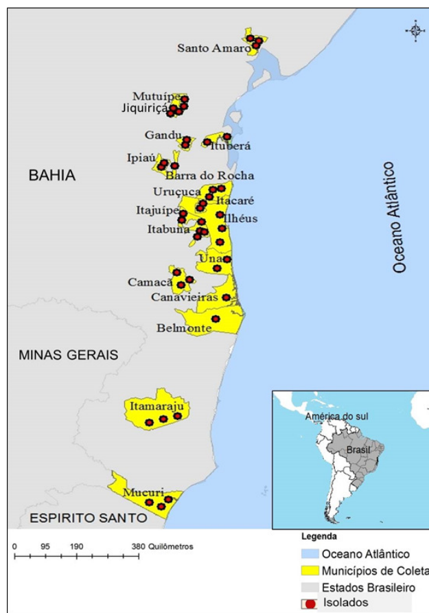
Figura 1- Mapa dos municípios da Bahia onde foram realizadas coletas de isolados de Ceratocystis cacaofunesta .

(Magalhães et al., 2016). Folhas imaturas de cacauzeiro (40 a 50 dias de expandidas) foram feridas na nervura central com uma lâmina esterilizada e discos de folhas de 1,5 cm de diâmetro foram cortados usando cortador semiautomático e colocados com a superfície abaxial para cima, sobre espuma umedecida com água esterilizada mantidos em caixas plásticas.