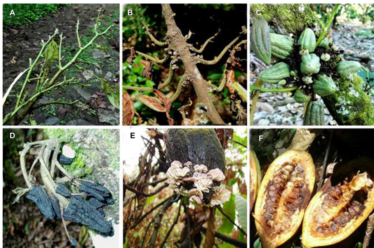
Figura 3. Sintomas típicos da vassoura-de-bruxa do cacaueiro causados por Moniliophthora perniciosa em cacauais do estado do Espírito Santo (ES) Brasil: (A) vassoura vegetativa verde; (B) vassoura seca com sintoma de engrossamento e presença de basidiomas; (C) frutos modificados no formato morango e cenoura; (D) frutos em formato de morango e cenoura mumificados; (E) frutos mumificados com presença de basidiomas; (F) fruto lesionado com sementes necrosadas.

Muitas áreas das fazendas visitadas foram classificadas como economicamente inviáveis. A ausência de medidas de controle nestes casos favorece a pressão do inóculo, colocando em risco as variedades resistentes de cacaueiros. As almofadas florais doentes apresentaram flores hipertrofiadas, vassouras e frutos partenocárpicos denominados “morangos” e “cenouras”, que não evoluem em tamanho, seguido de necrose generalizada dos tecidos. Os frutos doentes apresentaram lesões circulares na superfície externa de coloração negra que evoluíram a total necrose. Frutos necróticos apresentaram-se colonizados com o micélio dicariótico, característico desta fase. A alta