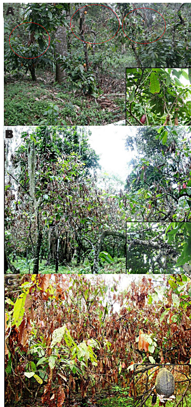
Figura 2. Níveis de severidade da doença vassoura-de-bruxa do cacauero nas lavouras do estado do Espírito Santo (ES) Brasil. (A) Nível 1, (B) Nível 2 e (C) Nível 3.

do ES apresentaram três níveis de doença. De todas as fazendas prospectadas 28% apresentaram nível 1, 40% apresentaram nível 2 e 32% apresentaram nível 3. Caracterizou-se também a sintomatologia nos diferentes níveis de severidade pela observação direta dos sintomas, a qual foi registrada através de fotografias