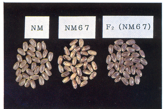
第2図 NM、NM67の玄米、及びNM67×NMのF 2 に突いたNM67型の低グルテリン蛋白変異を示す玄米。